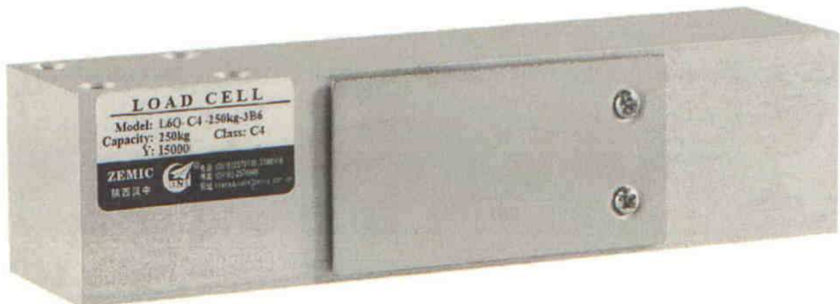
Bild: Wägezelle Typ L6Q / 250 kg

The load cells of the series L6Q are shear beam load cells made of aluminium. The strain gauge application is covered with silicon. Further essential characteristics are given in the data sheet, s. page 5 to 6.